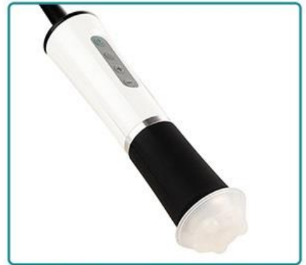
CO2 Oxygen Technology