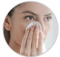
Balance oil water