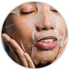
Fill water moisturizing