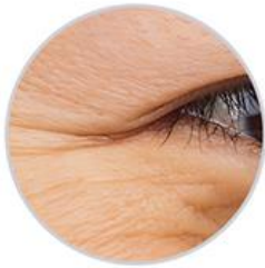
Lighten fine lines