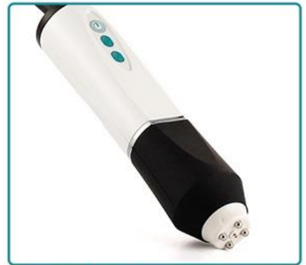
Tripollar RF Technology