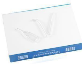
Ventouse de vidrio x 3 (Para vacío)