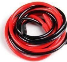
Mangueras (Para spray)