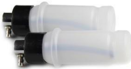
Botellas de spray x 2 (Para spray)