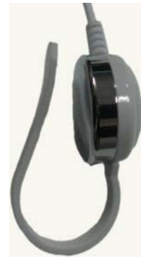
Tierra de corriente