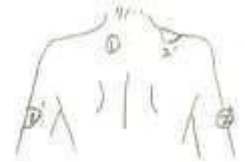
Imagen 3: Busto

Masajea el cuello, los hombros, estimula la circulación sanguínea para reducir la fatiga y aliviar el estrés; elimina la celulitis de los brazos y tensa el músculo caído para adelgazar los brazos.